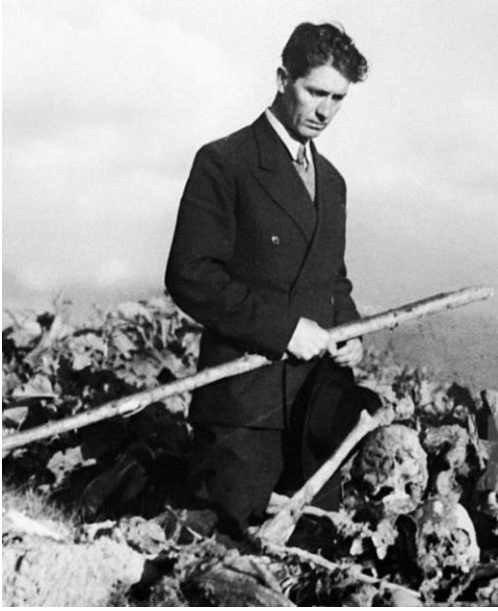
Corneliu Codreanu se arrodilla entre los huesos de los soldados muertos durante la Primera Guerra Mundial (1 de enero de 1936, en Predeal).

En las páginas que siguen, los lectores de este libro encontrarán con cierta sorpresa una serie de extractos de las obras de algunos eminentes patriotas rumanos, los cuales, en 1879, han luchado por los derechos de vida del pueblo rumano, afrontando valientemente las fuerzas amenazadoras de toda Europa.