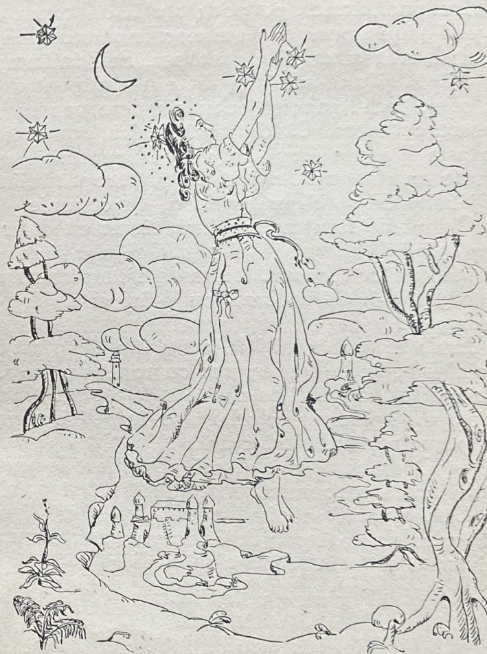
Zbură tot mai sus, până la nori, până la stele.

— Nenorocite, din toată puzderia de mândrețe văzute de tine, să iei o capră? Vrei să-mi cernești inima, să nu-mi rădă și mie fața? Vrei să mă îngropi cu zile?