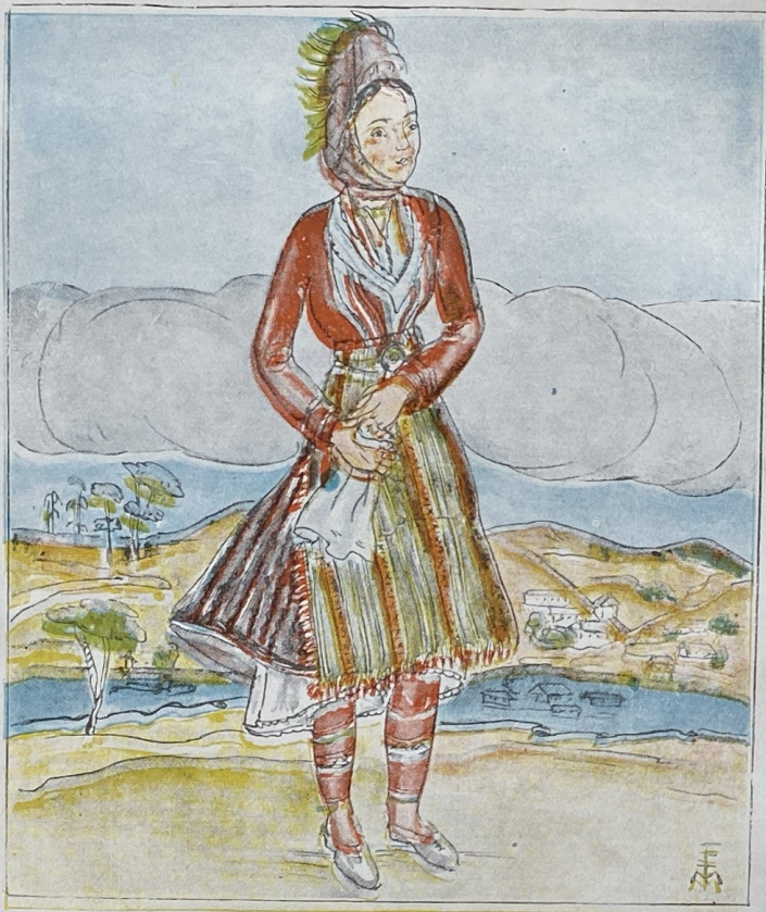
Fată din Pind, de T. Filionescu-Murnu