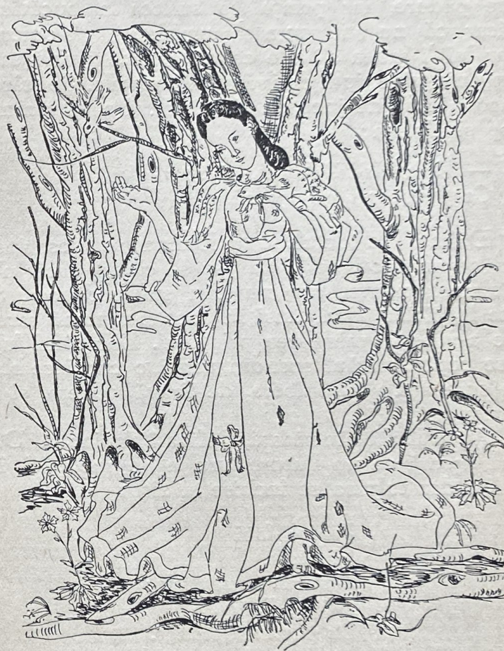
Deschide-te, dafine, să zbor afară ca fluturașul de ușoară.

— Astăzi veghez eu la mâncare, și tu mergi la vânătoare.