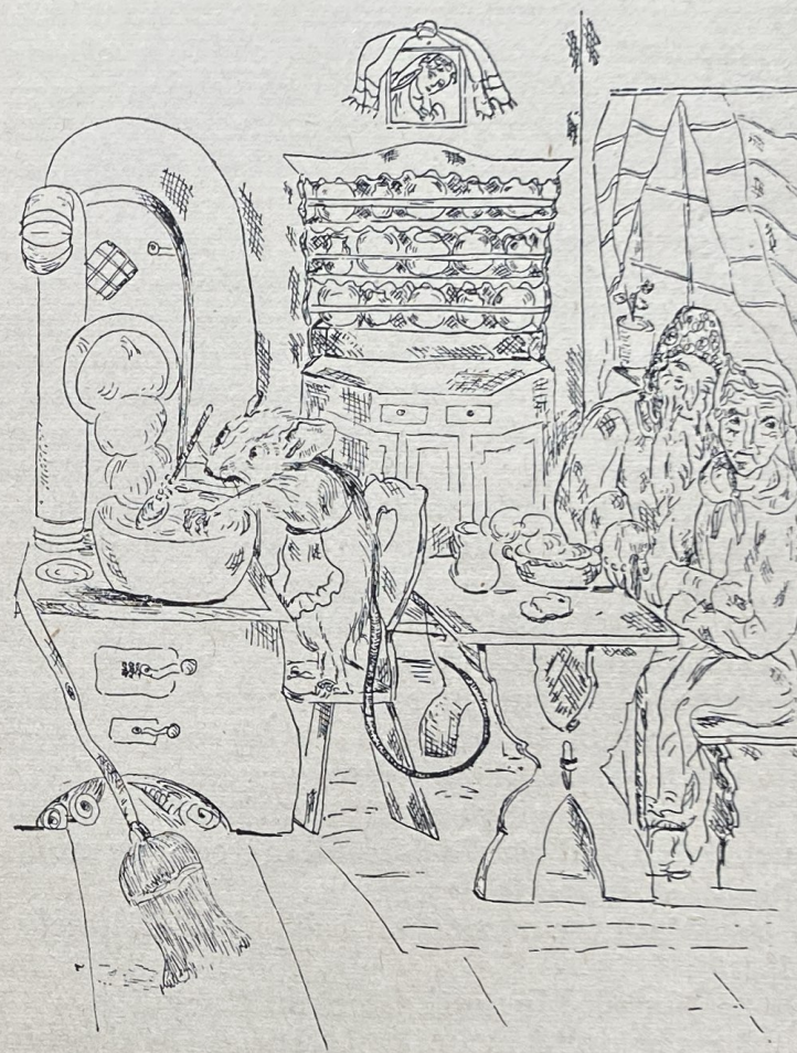
După ce potrivea căldarea cu grâu pe roate să fiarbă, o lăsă în paza lui Ciuciuli-Muciuli.

Când se sculă baba să ia mătura de după ușă, să strângă firimiturile și o ridică din loc — odată țuști—șoricelul. Baba pune mâna pe el și îl ia binișor ca pe un fecior al lor; ba îl și botează cu numele: Ciuciuli-Muciuli. Ciuciuli-Muciuli se făcu din ce în ce mai durduliu și mai sglobiu și mai crescă de o șchioapă.