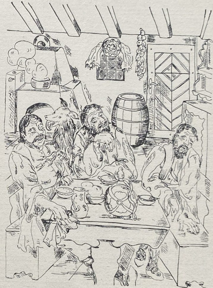
Căinele se apropie de leneși lingându-i de iaurt

Tărăș-mortiș sosiră în sat și traseră la un han. Hangiul se tăvăli de răs, când văzu treimea asta posnașă. Dar când zări galbenul în mâna lor,