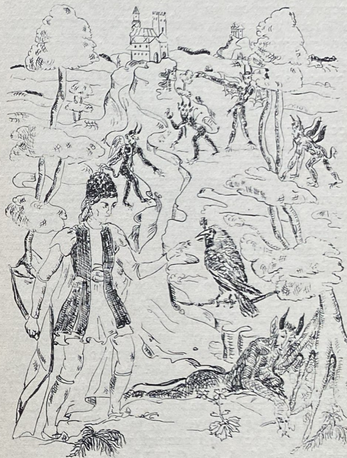
Puțin mai departe stă și corbul pe o ramură uscată cu crucea în plisc.

— Feciorul meu, corbul se află în palatul celor patruzeci de draci. Să te duci neînfricoșat, dar să ascuți și să nu ieși din vorbele mele: să te strecuri în grădină dimineța pela cântători, când toți dracii dorm cu dosul în sus, obosiți cum sunt de peste noapte. Să nu rupi nici o frunză din pomi, că au gură. Mai încolo vei ajunge în fața unei oglinzi de cleștar. La dus să nu te oglindești de