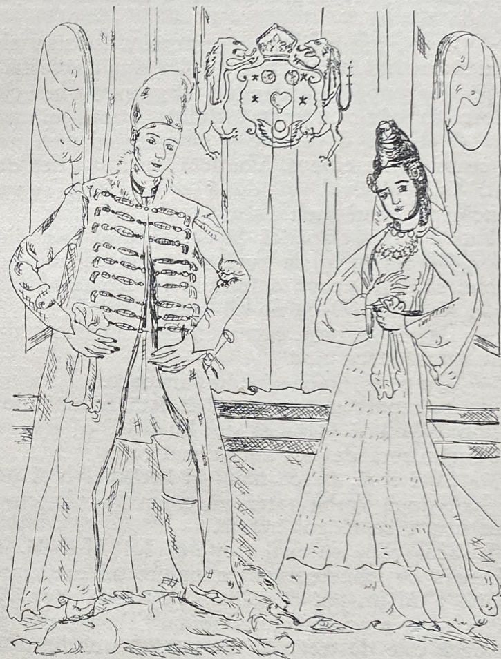
Și viteazul nostru fu răsplătit cu frumoasa frumoaselor Pirușana.

Așa se călători el după Pirușana fără știrea fraților lui. Și după vânturare de un an de zile se înfundă într'un desiș de pădure și nimeri la un palat așa de măreț și strălucitor, de se minună el singur, cum în asemenea pustietate răsări o