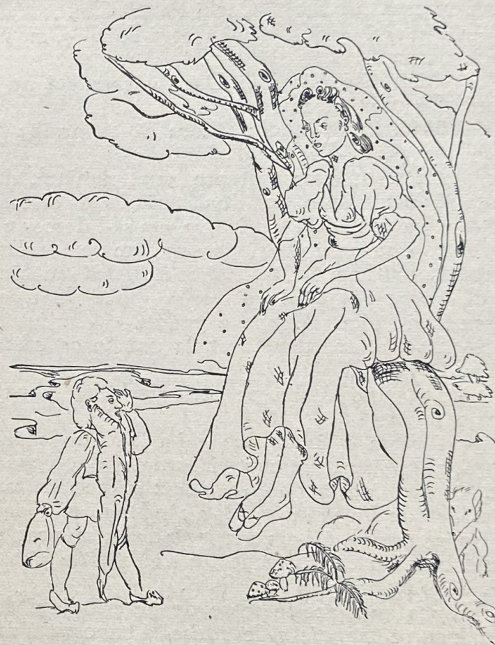
Barbă-Cot-și-Palmă-Om cu mireasa răpită.

Se dichisi și se împlăni bine jupâneasa vulpe