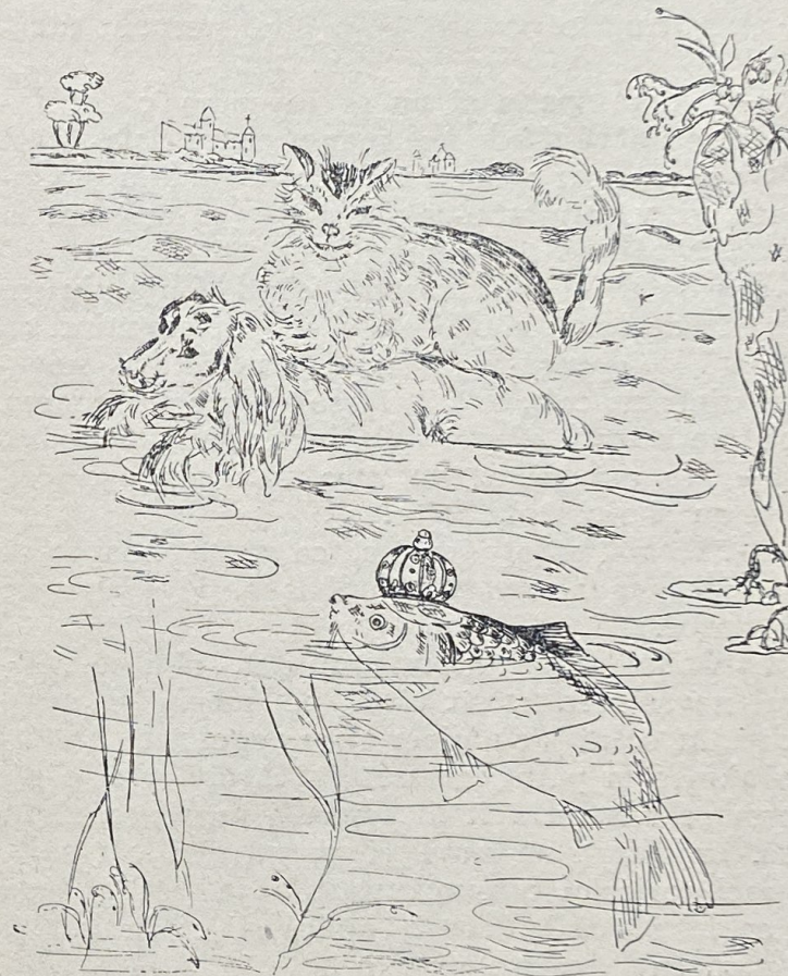
Pisica mai drăcoasă zări în apă un pește.

Și tocmai când plănua cu închipuirea lui cum să bată marea, că nu e lucru ușor s'o străbați toată, se pomeni în odae la el cu Mișului și Cuțului, dragii lui. Ei îl luară pe departe și întrebară ce i s'a întâmplat de e așa de îngrijo-